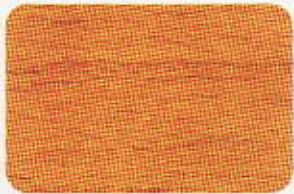
Golden Pine SS103

Unveil The Splendor of Wood Stain - Bring out the natural lustre of timber. See it come to life in sheer brilliance, time after time.